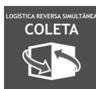
Imagem da Logo que compõe o Rótulo de Endereçamento da Logística Reversa Simultânea com Coleta

Obs: Informações do Data Matrix consta do Anexo 02 deste documento.